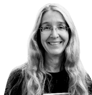
Доктор Уляна Супрун, в.о. Міністра охорони здоров'я

Те, що не увійде до програми «Доступні ліки», буде включено в тарифи на послуги, які, згідно з реформою, будуть закуповуватись у лікарнях з 2020 року.