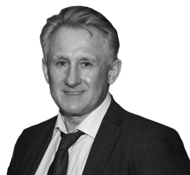
Роман Ілик, заступник Міністра охорони здоров'я України

Кожен лікар, лікуючи свого пацієнта, хоче бути впевненим, що хворий виконує його призначення. Адже результат лікування залежить від дотримання рекомендацій лікаря та систематичного прийому ліків. Передусім це стосується пацієнтів, які мають хронічні захворювання і повинні приймати ліки постійно. Зараз лікар не має можливості в цьому переконатися — він може тільки спонукати, переконувати й заохочувати. З появою е-рецепта лікар зможе впевнитися, що пацієнт принаймні відвідав аптеку та отримав призначені ним ліки.