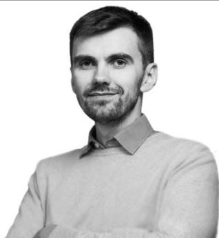
Павло Ковтонюк, заступник Міністра охорони здоров'я

Е-рецепт та електронний моніторинг програми «Доступні ліки» стануть підґрунтям для збільшення фінансування та розширення програми на інші групи захворювань та ліків.